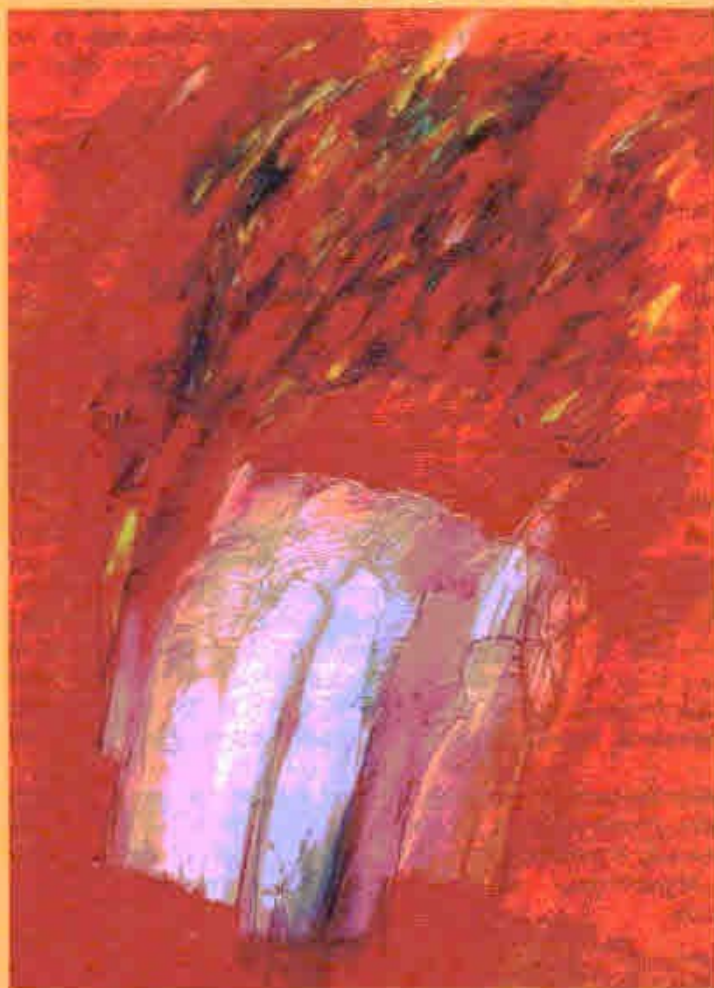
Mehmet Güler, DEINE SONNE, Öl (Original: 140 x 50 cm) 2009